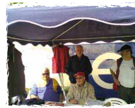
Stand à la Fête du Nautisme

Au total, plus de 1750 participations ont été enregistrées à l'actif de ces manifestations conviviales, qui permettent tout autant de se remémorer nos sorties en mer ou nos pêches miraculeuses et de prolonger la saison.