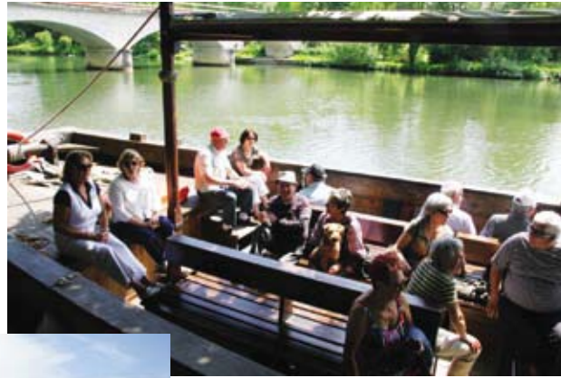
Sortie en gabarre