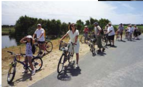
Vélo à Loix