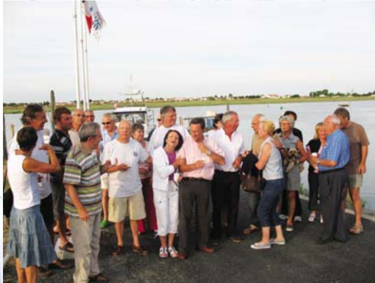
La Faute sur Mer