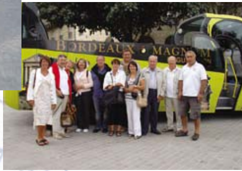
Escapade en Bordelais