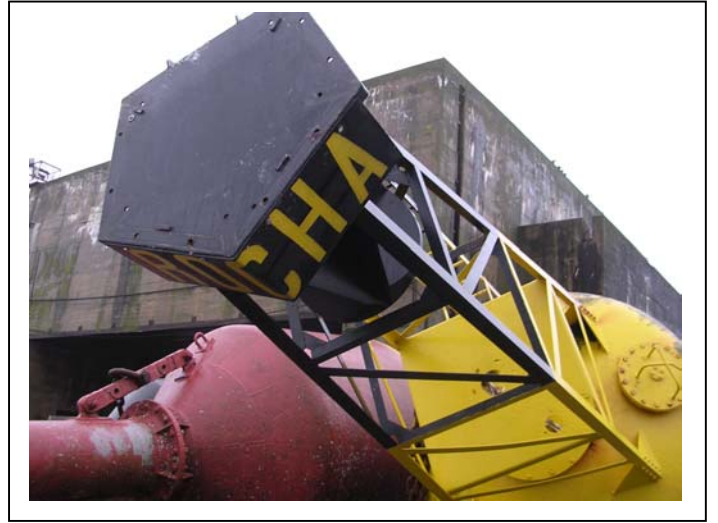
Le Rocha qui se situe maintenant au service de balisage à La Pallice