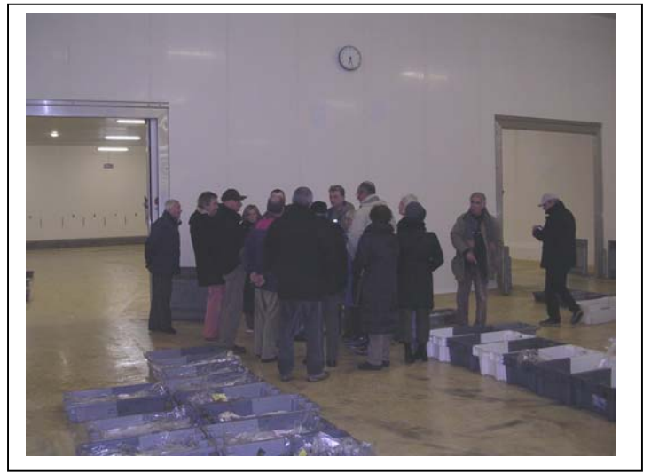
Visite de la Criée à Chef de Baie : Mercredi 8 mars 2006