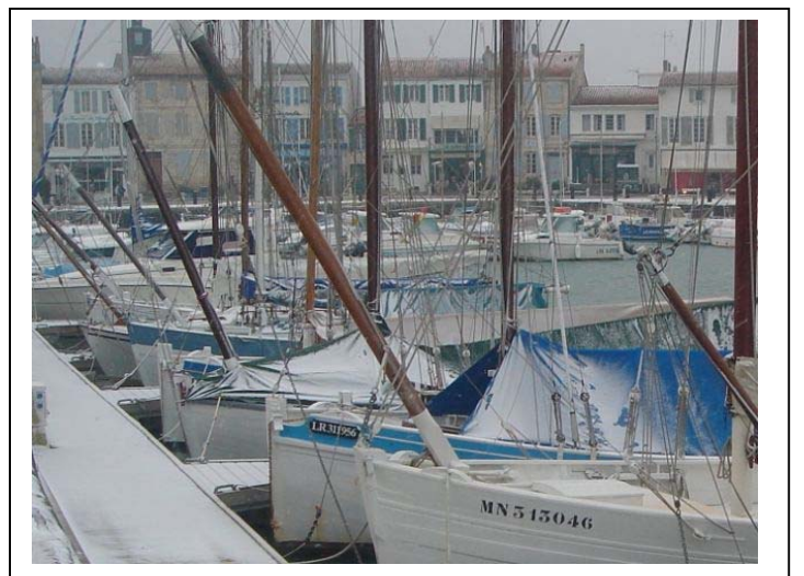
La Flotte en Ré sous la neige