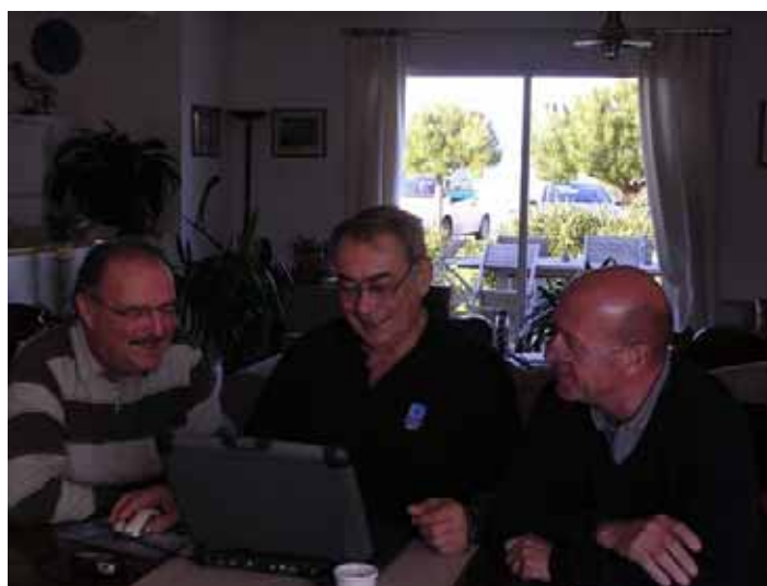
Le comité de rédaction du BNLF