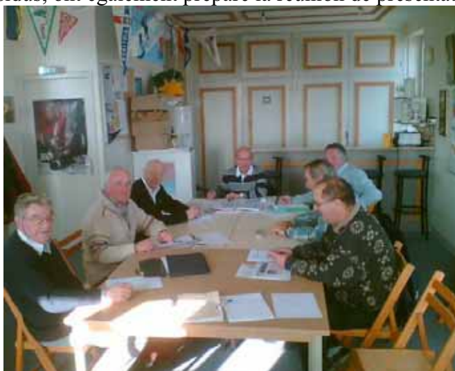
La commission en plein travail

Trois réunions ont à ce titre été programmées entre janvier et mars, au cours desquelles les membres de cette commission, très assidus, ont également préparé la réunion de présentation De la saison 2008.