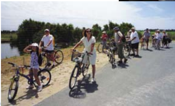
Vélo à Loix