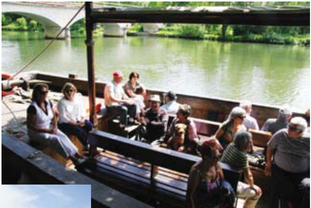
Sortie en gabarre