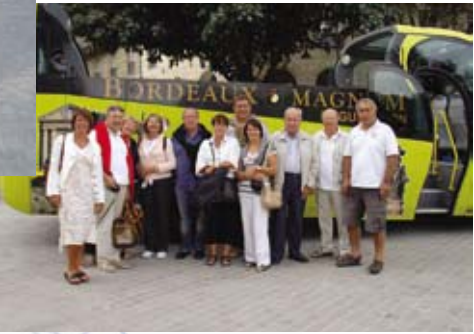
Escapade en Bordelais