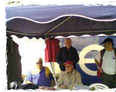
Stand à la Fête du Nautisme

Au total, plus de 1750 participations ont été enregistrées à l'actif de ces manifestations conviviales, qui permettent tout autant de se remémorer nos sorties en mer ou nos pêches miraculeuses et de prolonger la saison.