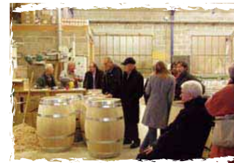
Maine au Bois